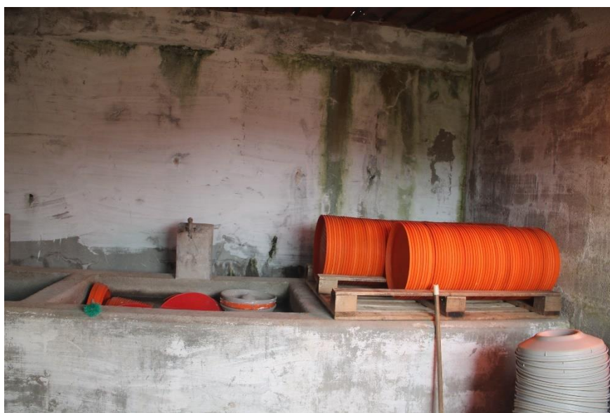
Figura 5 – Lavagem dos pratos

Os pratos de ração, inicialmente recolhidos são, entretanto, lavados com uma solução de hipoclorito, conforme se ilustra na Figura 5, sendo colocados no pavilhão apenas aquando da preparação do mesmo para o povoamento seguinte.