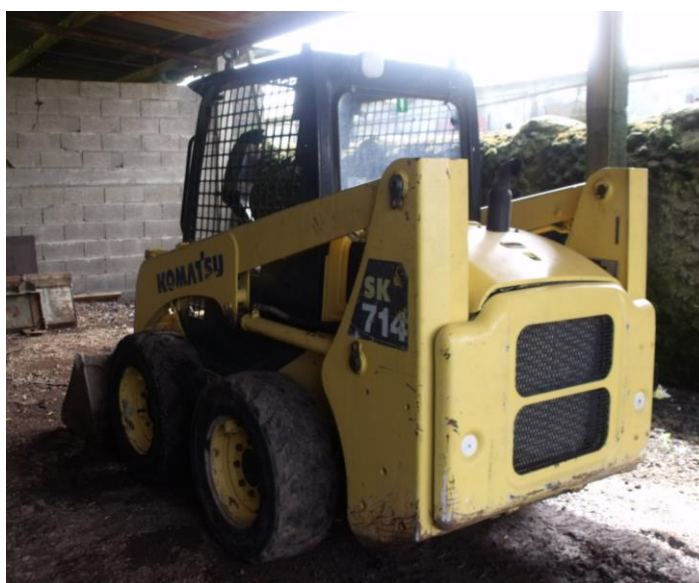
Figura 4 – Remoção dos pratos

Procede-se então à remoção das camas, que resultam das aparas, inicialmente colocadas, com os dejetos dos animais. A remoção é realizada por uma máquina “tipo Bobcat”, veja-se a Figura 4, e carregado imediatamente no camião que as transportará até ao seu destino final, sendo de imediato recolhidas pelos agricultores por constituírem um estrume muito adequado à fertilização das terras. A Saiprossem desconhece o processamento dado a este estrume após a recolha que é efetuada pelos agricultores.