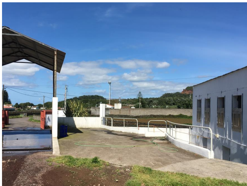
Figura 6 – Zona de lavagem