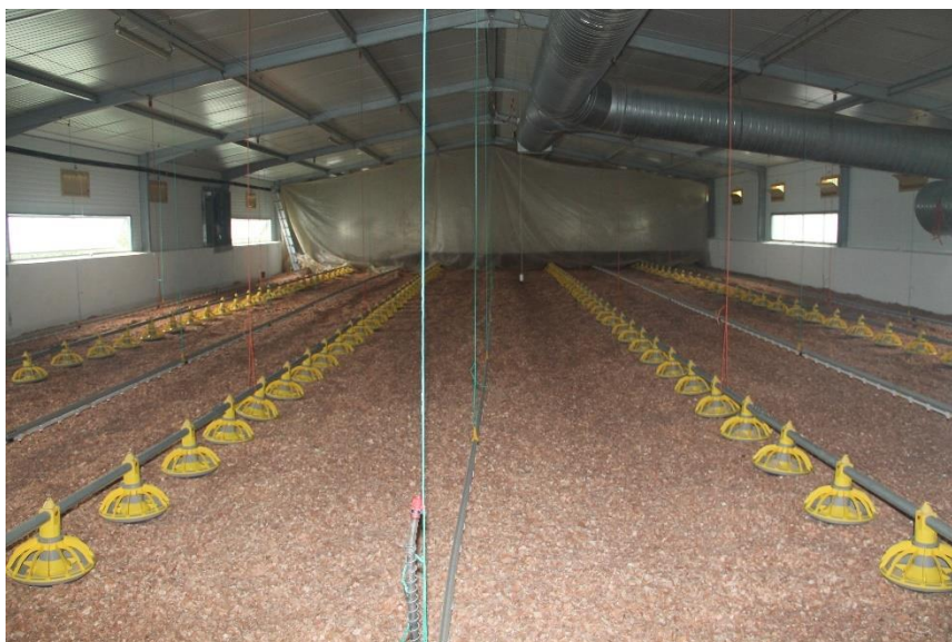
Figura 1 – Pavilhão preparado para receber pintos

O pavilhão a povoar é previamente preparado, sendo dividido com plásticos próprios e aquecido a uma temperatura de 33°C. Os plásticos permitem reduzir a capacidade do pavilhão para os pintos com apenas um dia, tornando pavilhão energeticamente mais eficiente. Os bebedouros são colocados no nível mais baixo assim como os comedouros e são colocados pratos de primeira idade também com ração. Na Figura 1 ilustra-se o descrito.