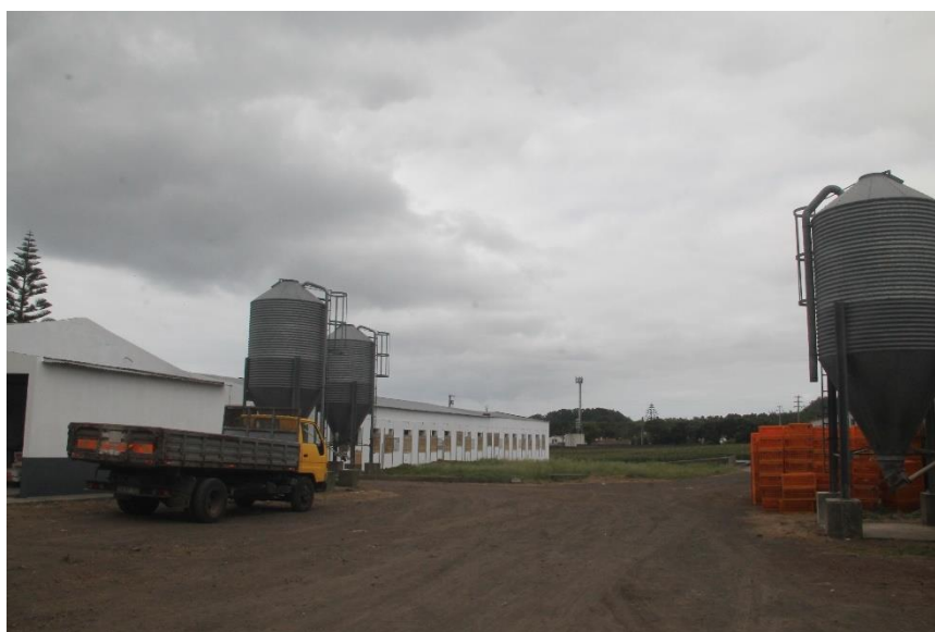
Figura 2 – Silo de armazenamento de ração

Conforme a idade dos animais a temperatura necessária vai reduzindo, a necessidade de ventilação aumenta, e o nível de altura das pipetas de água e dos comedouros também aumenta. Todos os pavilhões estão dotados de sistema automático de fornecimento de alimentação e água, havendo em cada pavilhão um reservatório de água que garante o seu fornecimento em caso de corte de abastecimento. Cada pavilhão possui um silo de ração, como se ilustra na Figura 2.