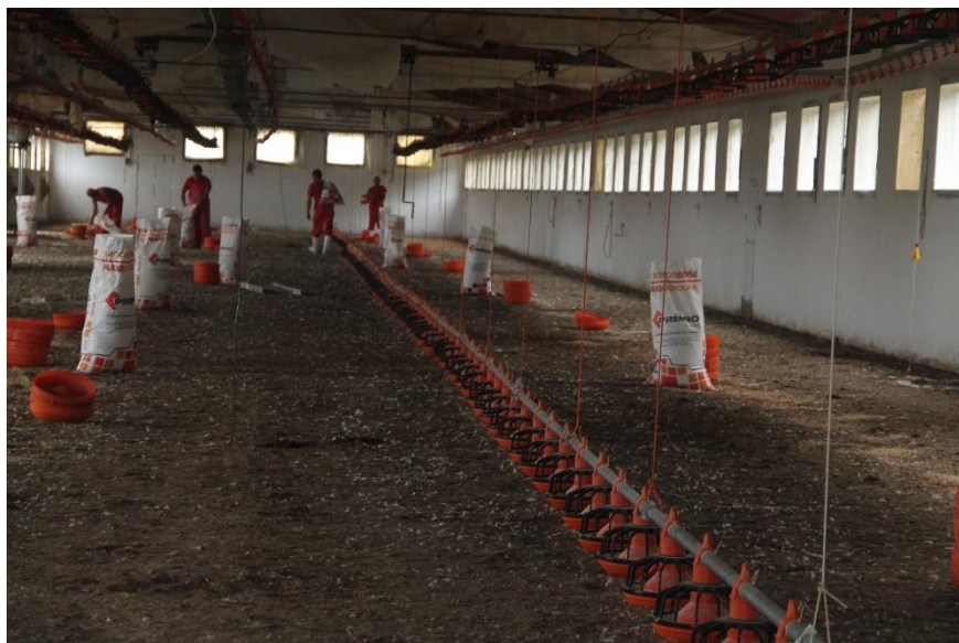
Figura 3 – Remoção dos pratos

Procede-se então à remoção das camas, que resultam das aparas, inicialmente colocadas, com os dejetos dos animais. A remoção é realizada por uma máquina “tipo Bobcat”, veja-se a Figura 4, e carregado imediatamente no camião que as transportará até ao seu destino final, sendo de imediato recolhidas pelos agricultores por constituírem um estrume muito adequado à fertilização das terras. A Saiprossem desconhece o processamento dado a este estrume após a recolha que é efetuada pelos agricultores.